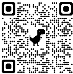
QR Code für den Petze Flyer

Die PETZE macht sich stark für die Zusammenarbeit verschiedenster Akteur:innen zur Schaffung verlässlicher Netzwerke und zur festen Verankerung hochwertiger Präventionsarbeit in der Gesellschaft ( www.petze-institut.de/ueber-die-petze/ ).