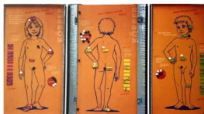
Abbildung eines nackten Jungen (Zeichnung) mit der Möglichkeit, die Bezeichnungen der Körperteile mittels entsprechend beschrifteter Magnete zuzuordnen. Die Kinder kennzeichnen mit verschiedenfarbigen Magneten die Körperteile, an denen sie berührt, bzw. nicht berührt werden mögen.